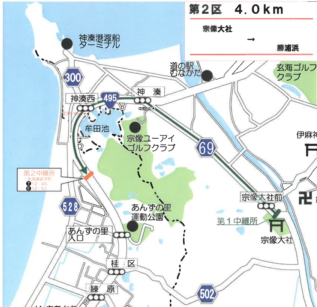
第2中継所付近（勝浦浜）