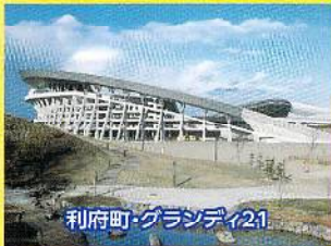
利府町・グランディ21