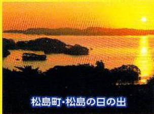
松島町・松島の日の出