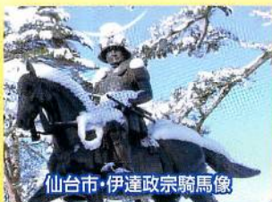
仙台市・伊達政宗騎馬像

中 国 実 業 団 連 盟 代 表 天 満 屋 (岡 山 / 23) エ ティ オ ン (広 島 / 24)