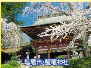
塩竈市・鹽電神社