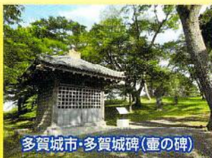
多賀城市・多賀城碑(重の碑)