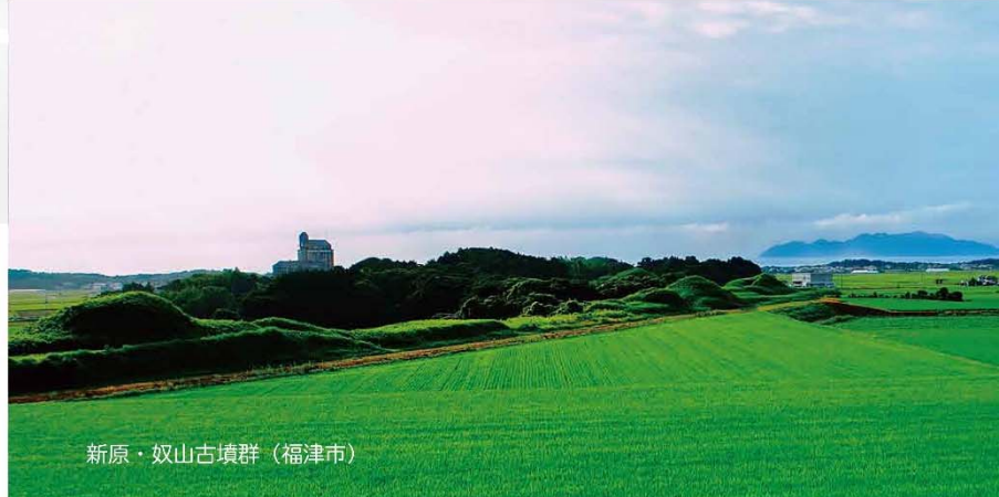
新原・奴山古墳群 (福津市)