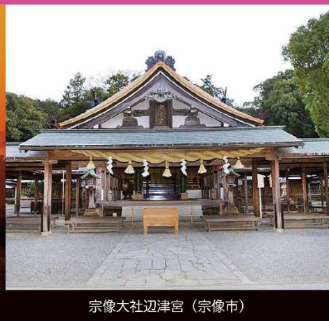
宗像大社辺津宮 (宗像市)