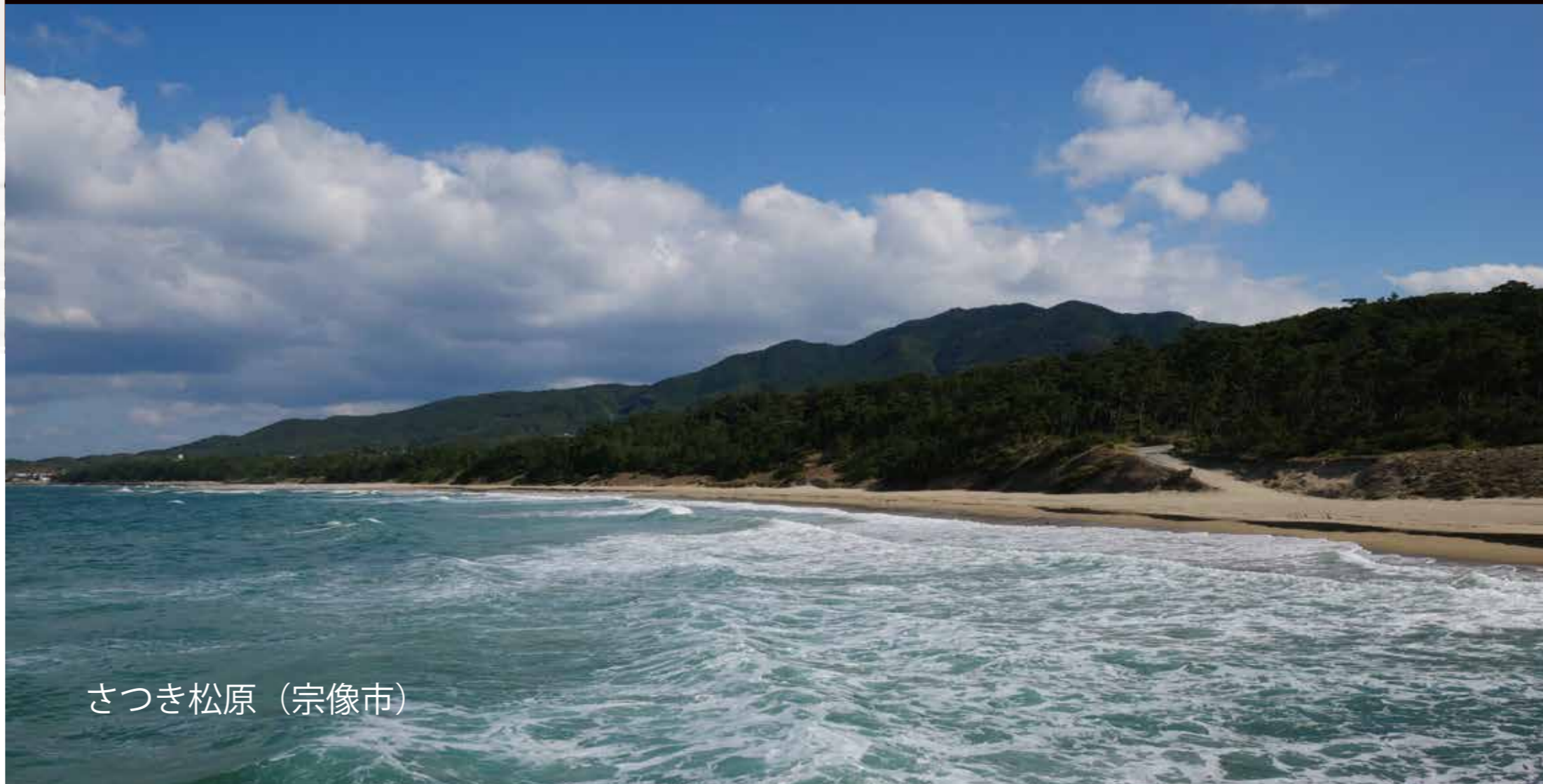
さつき松原 (宗像市)