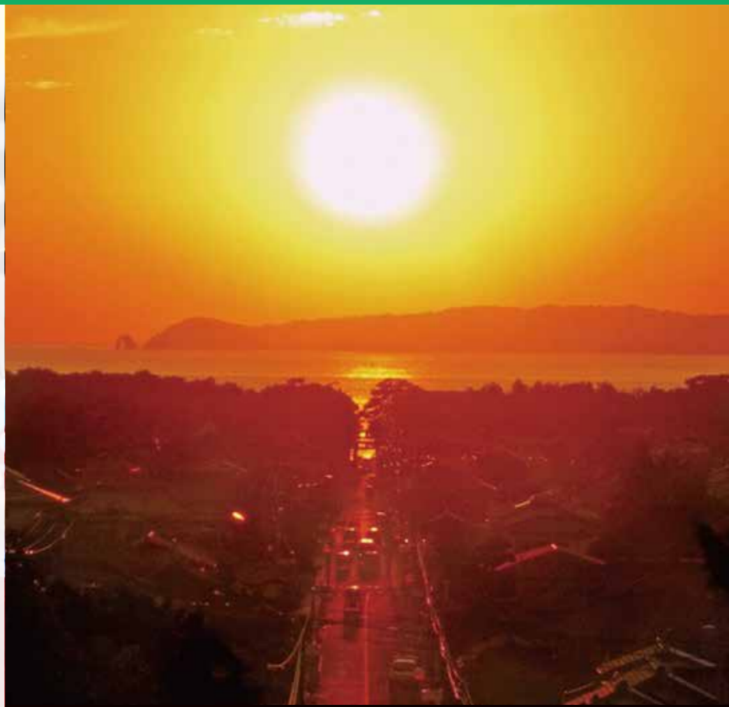
宮地嶽神社からの光の道 (福津市)