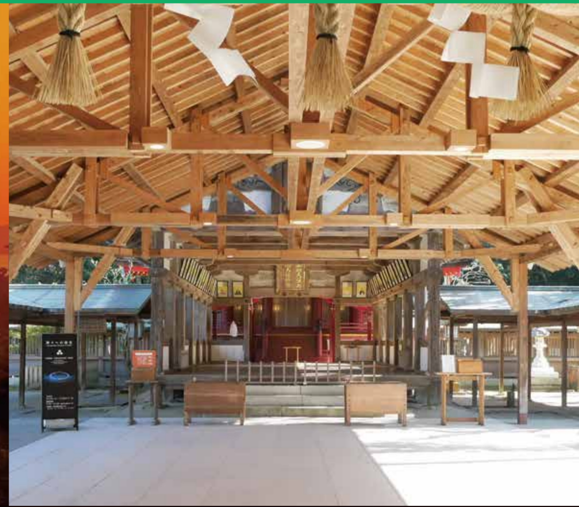
宗像大社辺津宮 (宗像市)