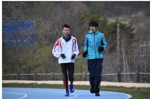
▲スタッフもガイドを体験