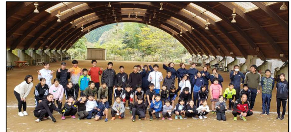
※市川町広報に掲載