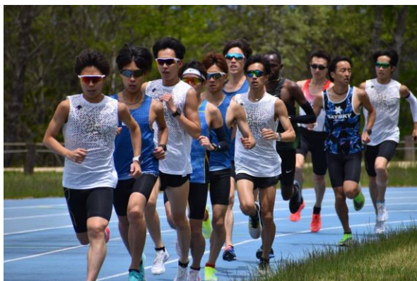
▲全体練習に参加（最後尾）

また、ブラインドマラソンの認知向上や視覚障がいに対する理解を深めるべく活動内容をSNSで発信。