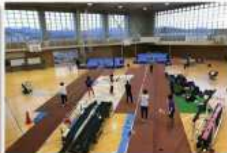
刈羽中学校体育館