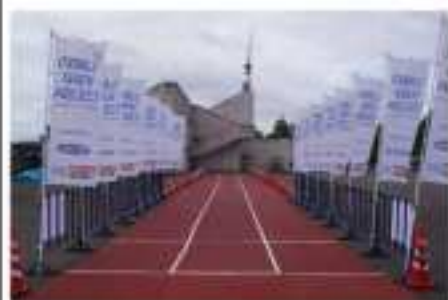
長岡市陸上競技場 ※新潟県選手権 特設ウォームアップエリアとして活用