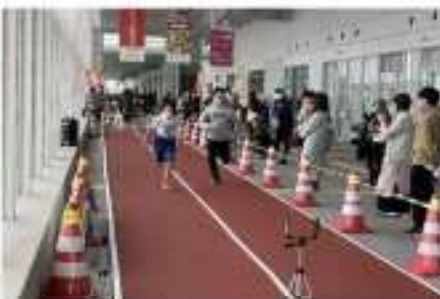
朱鷺メッセエスプラナード