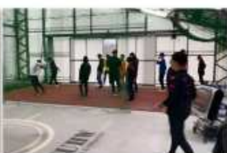
新潟医療福祉大学