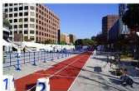
NHKスポーツフェスタ2022〜くまもとスポーツ全力応援!〜