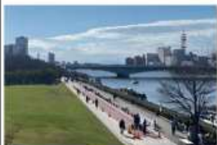
朱鷺メッセリバーフロントパーク