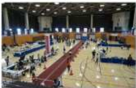
スポーツ体験キャラバン〜にいがた子どものスポーツ応援プロジェクト〜