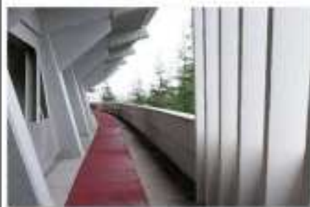
新潟市陸上競技場