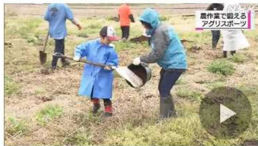
農作業で鍛える アグリスポーツ

農作業を通して子どもたちの体を鍛える「アグリスポーツ」という新しい取り組みが、射水市で始まりました。