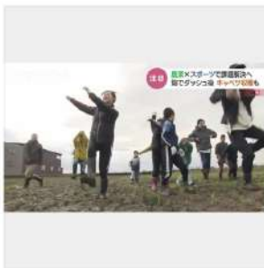
チューリップテレビ

キャベツ畑を全力疾走? 農作業をしながら体を鍛える「アグリスポーツ」と呼ばれる新たな取り組みが注目されています。若い世代に農業に親しんでもらうとともに、農地の利活用にも期待できる取り組みです。